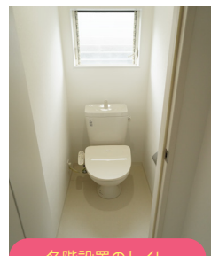
各階設置のトイレ お風呂