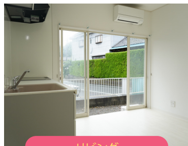
リビング (共用スペース)